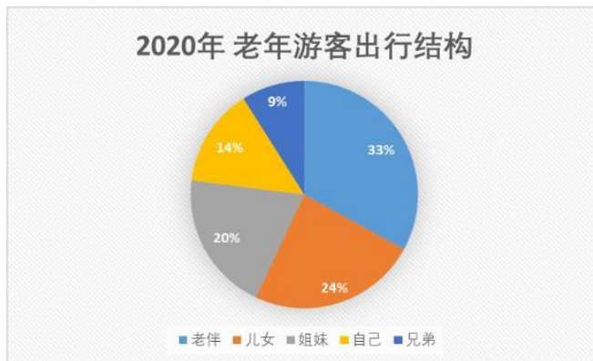
2020年 老年游客出行结构

报告显示，三亚当之无愧成为年度最热门目的地。不仅北方的老年游客爱去三亚，广州、深圳、重庆的老年游客也都心向往之。2020年，老年游客的心不在亚龙湾，就在海棠湾。